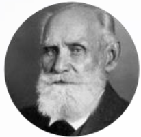
Иван Петрович Павлов