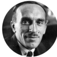
Николай Николаевич Семёнов