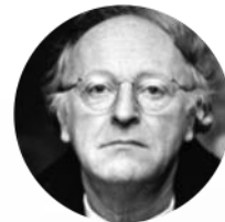
Иосиф Александрович Бродский