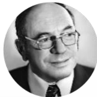
Леонид Витальевич Канторович