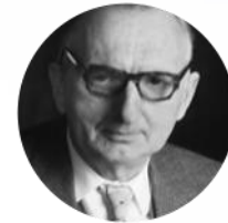
Александр Михайлович Прохоров