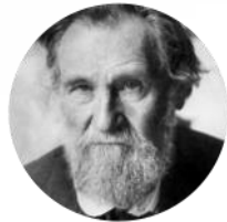
Илья Ильич Мечников