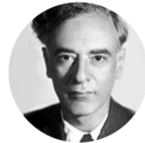
Лев Давидович Ландау