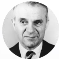
Василий Васильевич Леонтьев